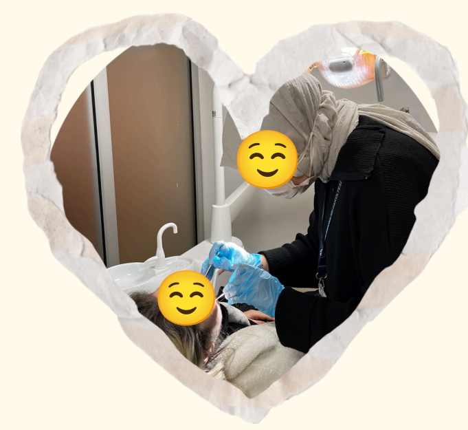
Resim 1. Özel bakım gereksinimli bireyin ağız ve diş sağlığı muayenesi

2025-2026 Eğitim-Öğretim döneminde Karadeniz Teknik Üniversitesi Diş Hekimliği Fakültesi'ne kayıt yaptıran ve aktif olarak projede yer alan Dönem 1 öğrenci grubu ile bu proje gerçekleştirildi. Her bir öğrencinin (n=5); lisans eğitimi öncesinde olan, çeşitli fakültelerde öğrenim gören veya mezuniyet sonrası dönemde bulunan ya da aktif olarak çalışan özel gereksinimli bireylere kendi imkânlarıyla erişimleri sağlandı. Bu projede; her bir özel bakım gereksinimli bireyin ağız ve diş sağlığı muayeneleri KTÜ Diş Hekimliği Fakültesi Ağız, Diş ve Çene Radyolojisi Anabilim Dalı'nda gerçekleştirildi (Resim 1 ve 5). Beş özel bakım gereksinimli bireyin ağız ve diş sağlığı açısından gerekli panoramik röntgenleri çekildi (Resim 2 ve 3). Muayene sürecinde öğrenciler gözlemci olarak yer aldı. Ardından KTÜ Diş Hekimliği Fakültesi Pedodonti Anabilim Dalı içerisinde yer alan Ağız ve Diş Sağlığı Eğitim odasında birebir olarak hastalara oral hijyen, beslenme ve rutin dental kontrolün önemiyle ilgili sunum yapıldı. Bu süreçte model aracılığıyla fırçalama ve diş ipi kullanımı eğitimleri verildi (Resim 4). Ardından özel bakım gereksinimli bireylerin ihtiyaç duydukları bölümlerde dental tedavileri için randevu almaları sağlandı. Bu süreçte özel bakım gereksinimli bireylerden geri bildirimler alındı ve öğrencilerin süreçle ilgili yaşadıkları kendi deneyimlerini içeren 2 dakikalık kısa videolar çekmeleri sağlandı.