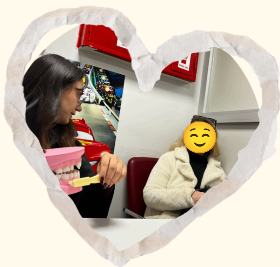
Resim 4. Ağız ve diş sağlığı eğitimi verilmesi