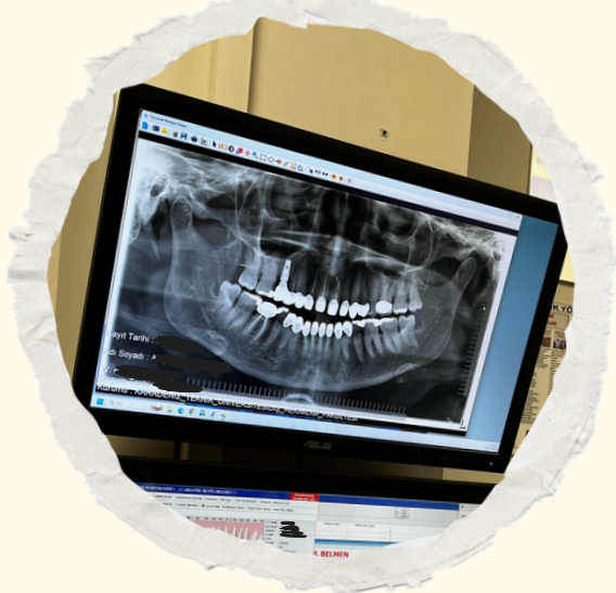
Resim 3. Örnek radyografik görüntü