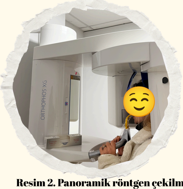
Resim 2. Panoramik röntgen çekilmesi