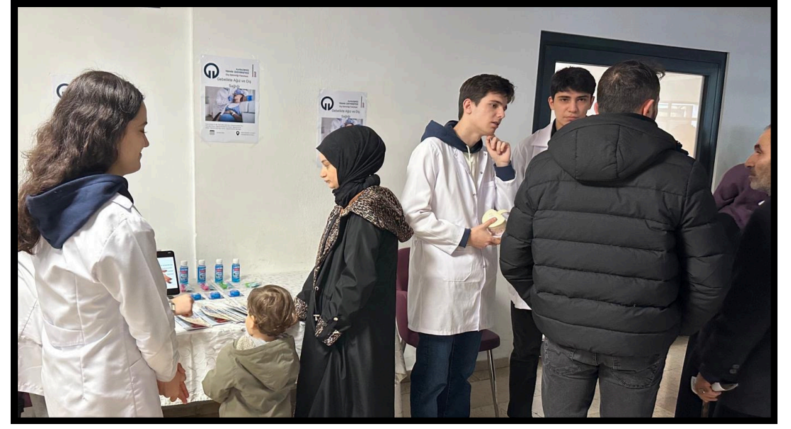
Resim 3. Hastalara yönelik bilgilendirme