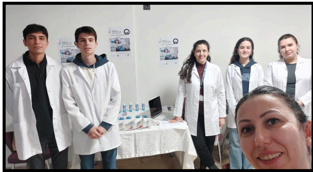
Resim 6. Proje ekibi