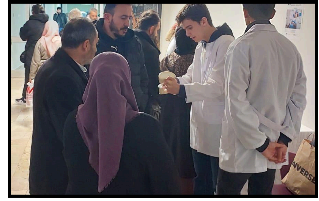
Resim 4. Hastalara yönelik bilgilendirme