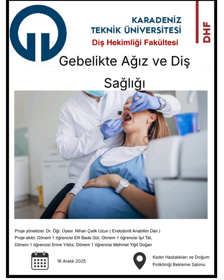
Resim 1. Ağız ve Diş Sağlığı Afişi

Proje kapsamında gerekli izinler alındıktan sonra, etkinliğe yönelik bir bilgilendirme afişi hazırlandı. (Resim 1) KTÜ Kadın Hastalıkları ve Doğum Polikliniği önünde bekleyen gebe hastalar ve hasta yakınlarına ağız ve diş sağlığına yönelik eğitici bir sunum yapıldı. Eğitim sırasında hazırlanan broşürler dağıtıldı ve doğru diş fırçalama teknikleri uygulamalı olarak gösterildi. Sunumda özellikle toplumda ağız ve diş sağlığıyla ilgili doğru bilinen yanlışlara değinildi. (Resim 2-7)