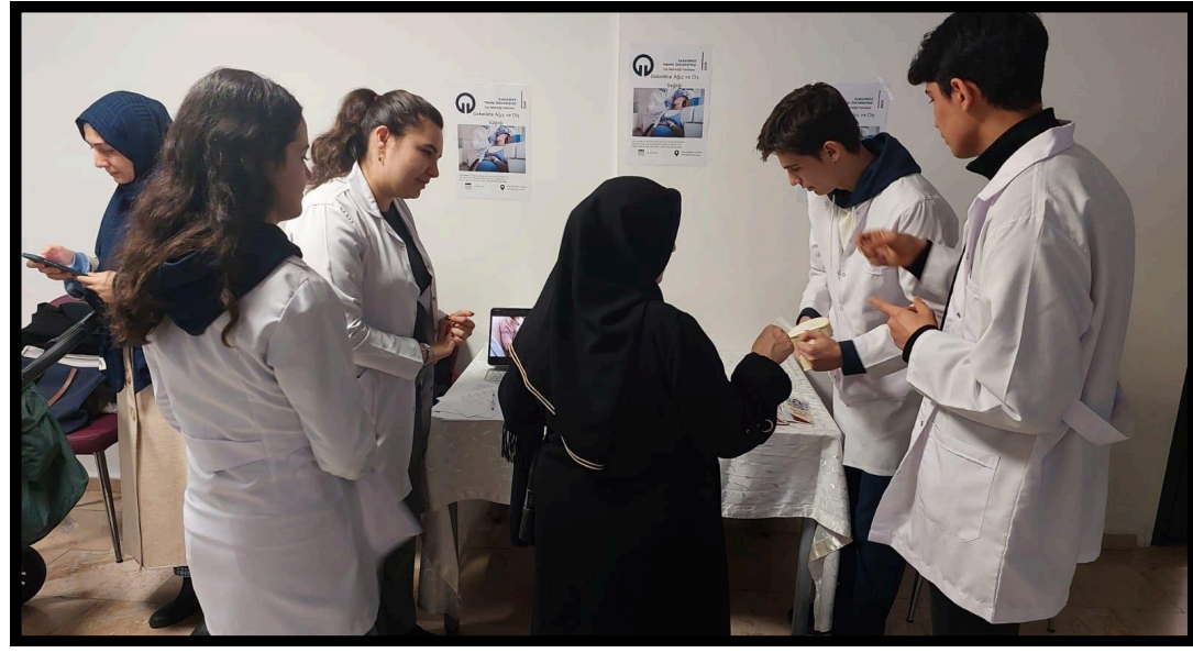
Resim 5. Hastalara yönelik bilgilendirme