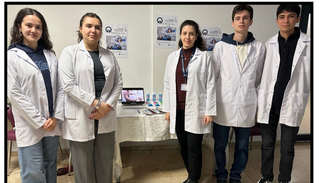
Resim 7. Proje ekibi