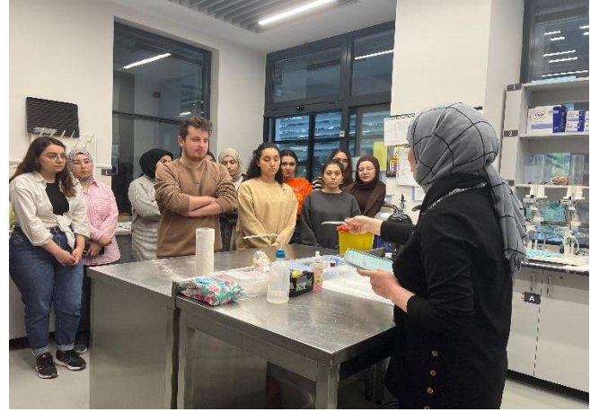
Eczacılık Fakültesi öğrencileri Farmakolojide Araştırma Teknikleri dersi kapsamında laboratuvar ziyareti