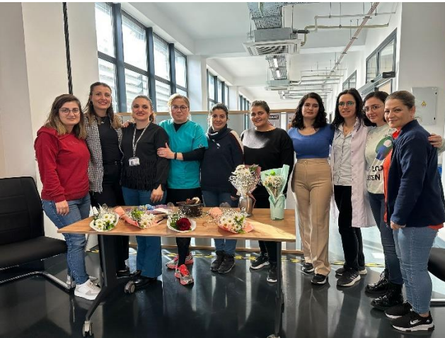
8 Mart Dünya Kadınlar Günü Etkinliği