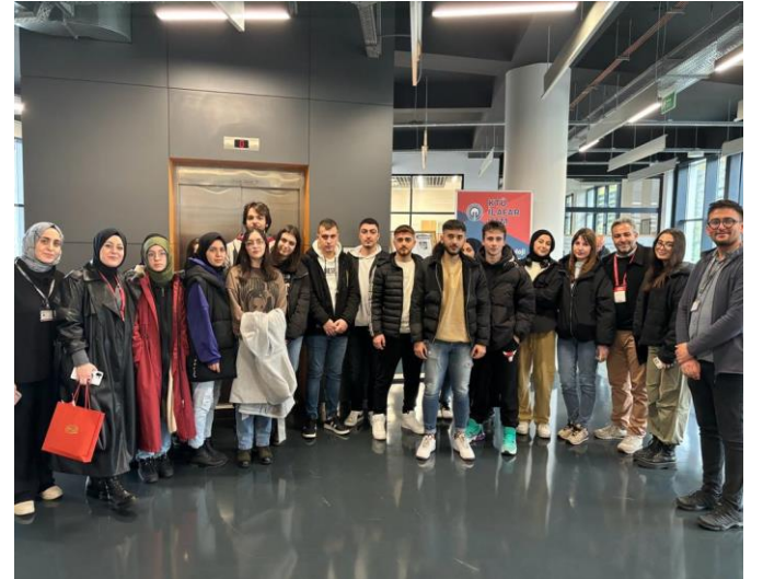
Seçkin Nüans Gelişim Kursu hocaları ve öğrencileri