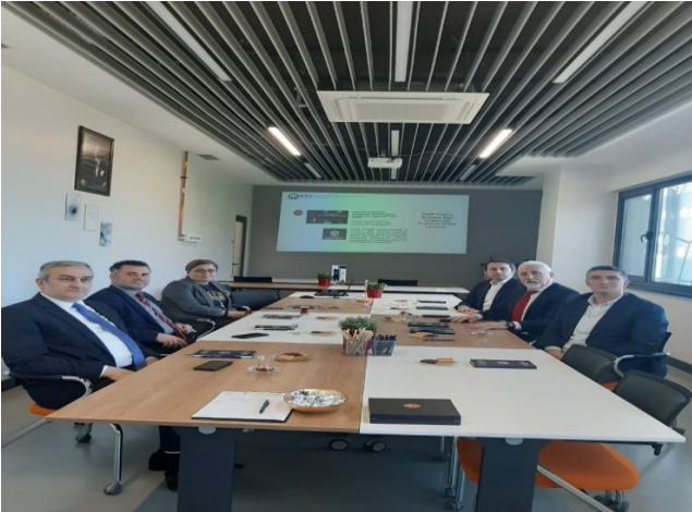
Trabzon Ticaret ve Sanayi Odası yetkilileri