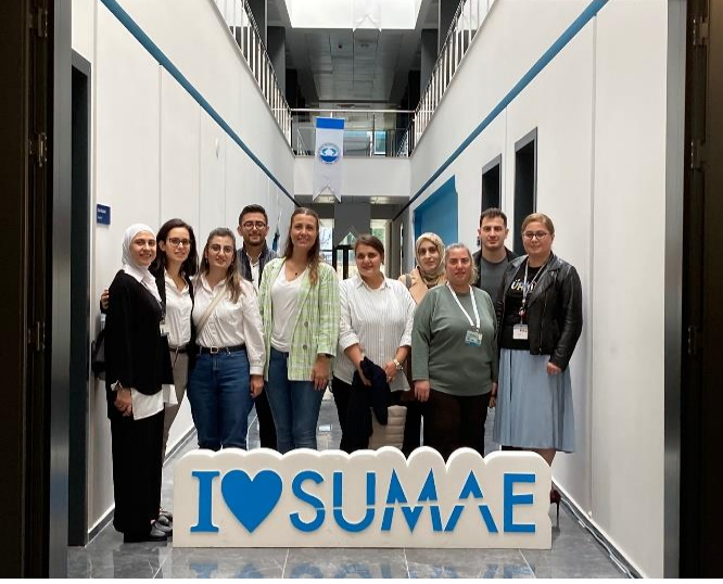
SOFAS 2023 toplantısı ve SUMAE ziyareti