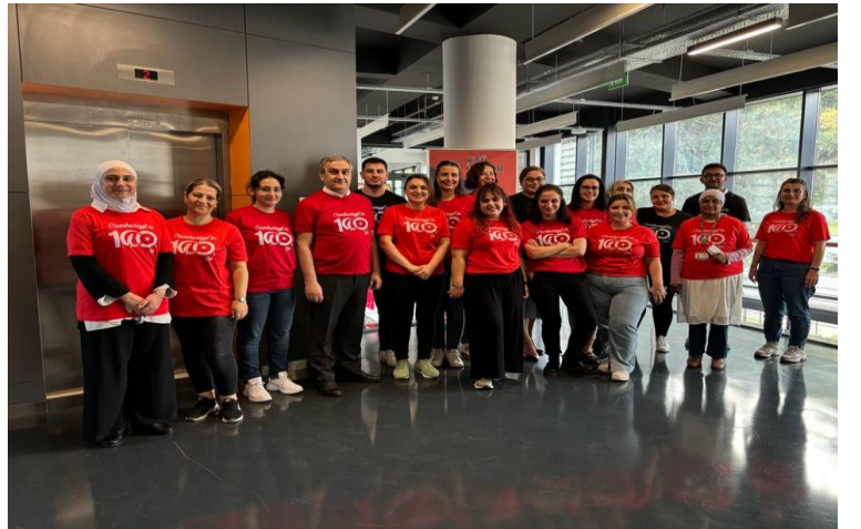
100. Yıl Etkinliği