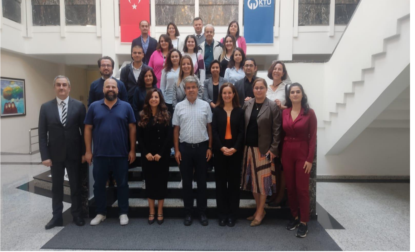
TÜBİTAK 1004 Yüksek Teknoloji Platformu tarafından yürütülen projenin toplantısı