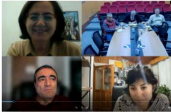
Uluslararası Ortak Bölüm Açma Çalışmaları